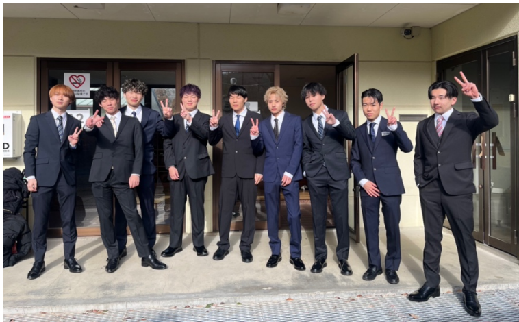
卒業式の朝 3年生たちはスーツでビシッと決めました