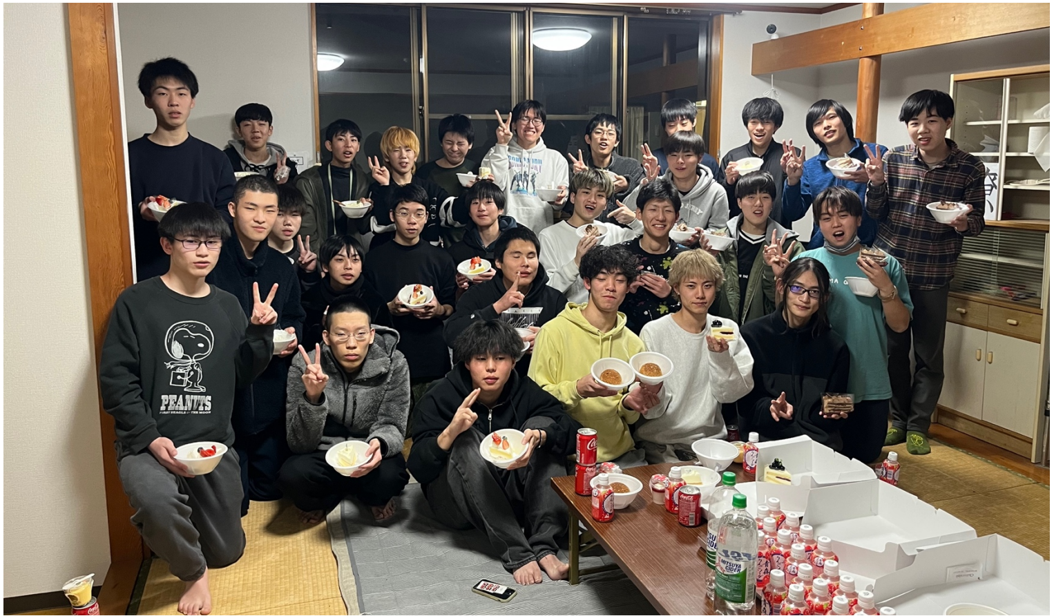
寮での卒業会 3年生と最後の夜