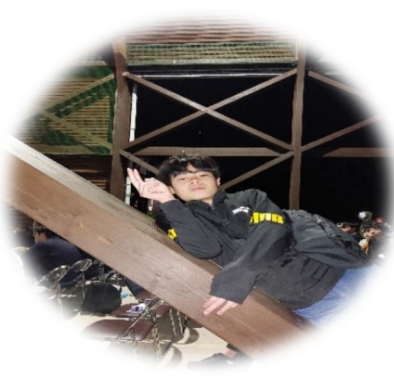
はじめてのハロウィン 🎃