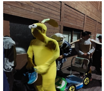
行儀よく順番待ちするピグミン